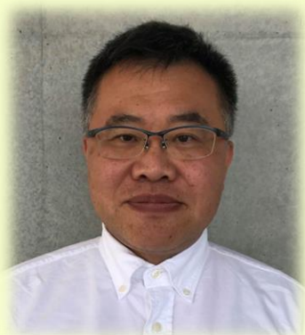
しまばら病院 心臓リハビリテーション室