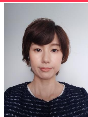
国立病院機構高知病院 リハビリテーション科

第1回となる本研究会がきっかけとなり、アジアとオーストラリア・ニュージーランドの研究や臨床が互いに発展することが期待されます。ふるってご参加ください。