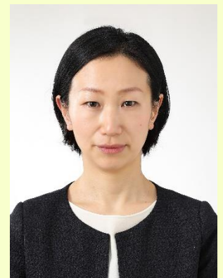
NTT東日本関東病院 栄養部