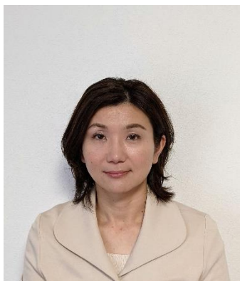
社会医療法人 原土井病院 薬剤部

ポリファーマシーは、単に服用する薬剤数が多いことではなく、それに関連した薬物有害事象のリスクの増加、服薬過誤、服薬アドヒアランス低下等の問題につながる状態です。ポリファーマシー対策は、フレイルやサルコペニアのリスクを増加させないために重要です。ポリファーマシーは、外来、急性期、回復期、療養期、慢性期など様々なケアステージに存在し、対策には多職種協力の協力が欠かせません。多職種カンファレンスが実施しやすい病院では、可能な限り処方調整を行い、次のケアステージへつなぐことが望まれます。また、処方変更の際は、定期的なモニタリングが必須です。高齢者の身体予備能力は、個人差はありますが中年期以前と比較して低いです。一度病態が下向きに進行すると元に戻るまでに困難が生じます。検討された薬の要・不要の判断には時間を要することが少なくありません。モニタリングが、ポリファーマシー是正の結果、病態安定を可能にします。