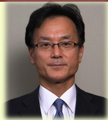
日本サルコペニア・フレイル学会 代表理事 国立長寿医療研究センター 理事長

第7回目のアジア・フレイル・サルコペニア学会は2021年11月5日(金)、6日(土)の2日間にわたって、韓国、水原市の光教にあるSuwon convention center (ソウル駅から地下鉄で30分)で開催されます。ハイブリッド開催の予定とのことでもうすぐホームページがオープンになります。あいにく日本の学会と重なりますので、現地参加は難しいかもしれませんが、Web参加は可能ですので、振るっての参加をお待ちしております。ホームページがオープンになりましたら、学会ホームページ、会員メールにてお知らせします。