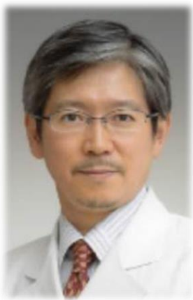
日本サルコペニア・ フレイル学会認定指導士 制度委員会 委員長 国立長寿医療研究センター