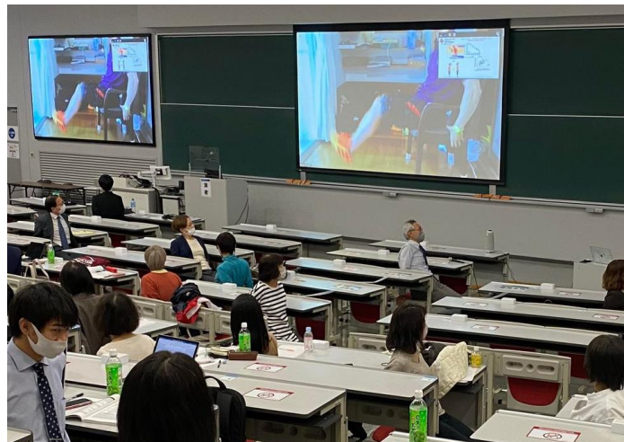
運動方法の実技を交えた実践的な講義がありました。