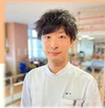
熊本リハビリテーション病院 リハビリテーション部