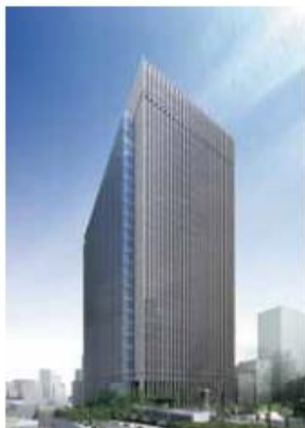
sola city Conference Center ソラシティカンファレンスセンター

筋肉という臓器の生理、病理、薬理が最近さらに明らかになってきました。筋肉のwellbeingについて様々な切り口から考えてみたいと思っております。会員の皆様全員のご参集を楽しみにしております。