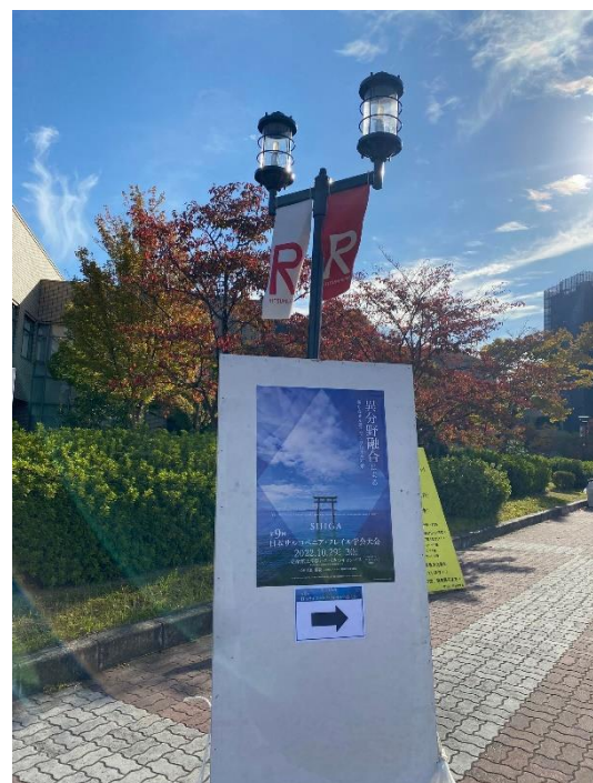
秋高く、木々が粧う素晴らしい季節に現地で語り合う事ができました。